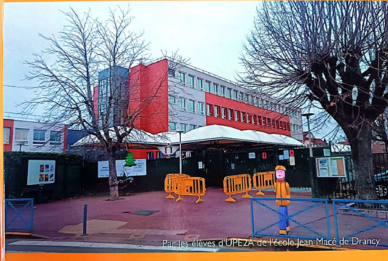
Production des élèves d'UPE2A de l'école élémentaire Jean Macé de Drancy (93)