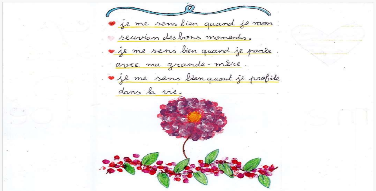
Production d'une élève d'UPE2A du collège Paul Klee à Thiais (94)

Les élèves sont maintenant impatients de découvrir le contenu de leurs sacs de livres. Nous leur souhaitons bonne lecture !