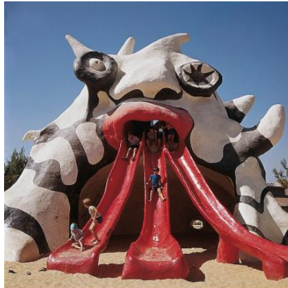
Le Golem, Niki de Saint Phalle, 1972 Jérusalem