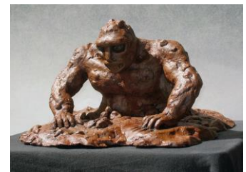
Golem de boue. Œuvre du sculpteur François