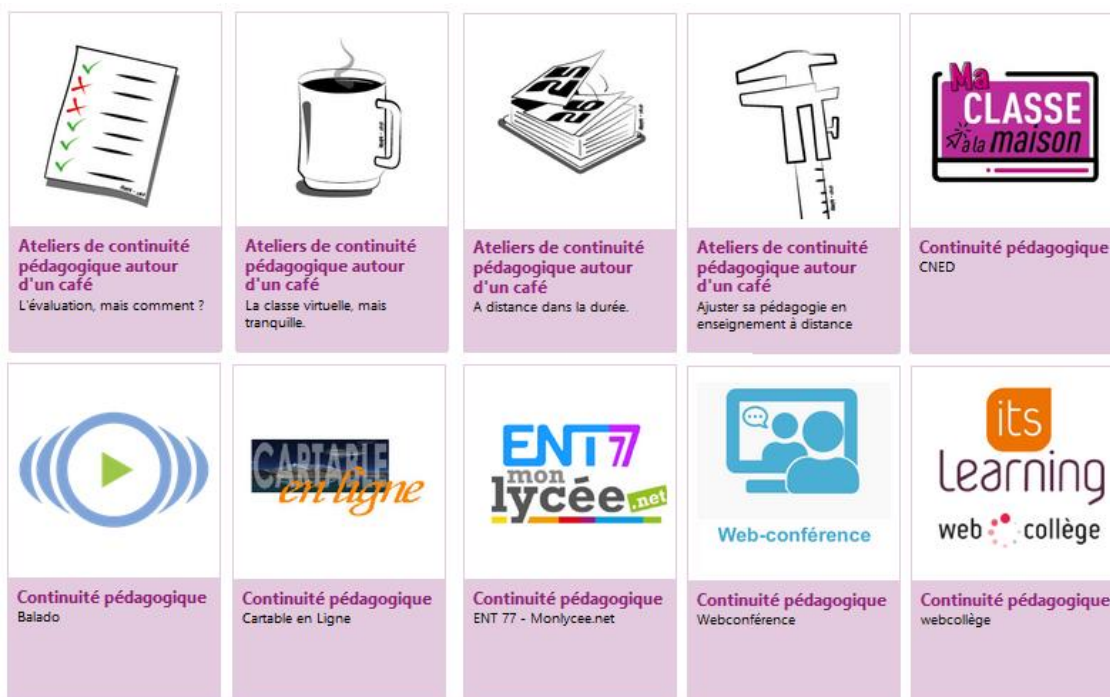
Les outils numériques à privilégier

Nous sommes bien conscients de votre engagement au service des élèves, de l'investissement et de l'énergie déployés depuis le début de cette période de confinement. À ce titre, nous vous remercions et vous renouvelons notre confiance. Nous sommes à vos côtés pour vous accompagner, tout comme les missions académiques, les divisions du rectorat et des DSDEN.