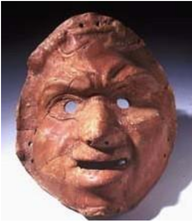
Masque de théâtre, musée gallo-romain de Saint-Romain-en-Gal

http://www.arts-spectacles.com/Rhone-Musees-gallo-romains-de%2%A0Lyon-Fourviere-et-Saint-Romain-en-Gal-Nuit-des-musees-17-mai_a495.html